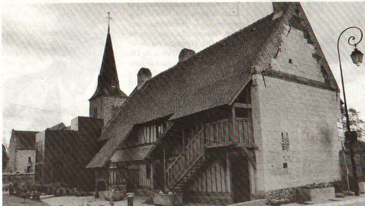
La guinguette rencontre le musée à l'occasion du premier anniversaire

Le samedi 16 mai, le Musée d'histoire de la vie quotidienne fête son premier anniversaire à Saint-Martin-en-Campagne. La commune et le personnel ont concocté un programme festif de 14 h à 23 h sur le thème « Muséo guinguette », fil conducteur de ces festivités qui couvre la période présentée dans le musée : de la fin du XIXe à la fin du XXe siècle. Au menu, des animations gratuites en plein air au-